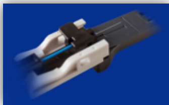
Misurare la lunghezza del taglio