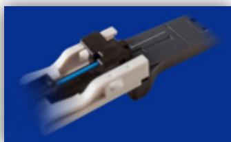
Misurare la lunghezza del taglio