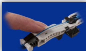
Verificare la flessione della fibra